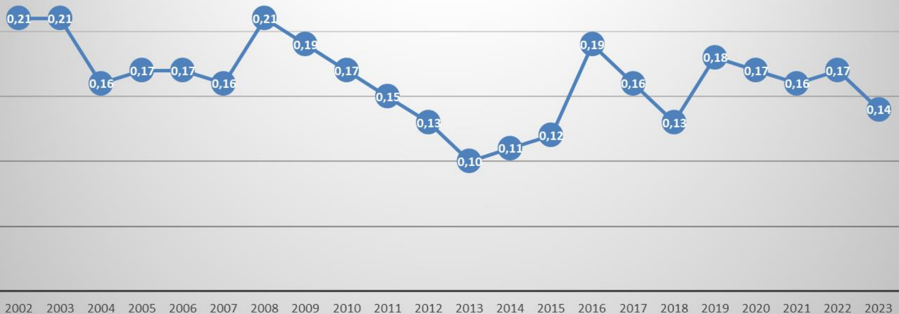
Ποσοστό ΟΔΑ/ΓΝΙ 2002-2023