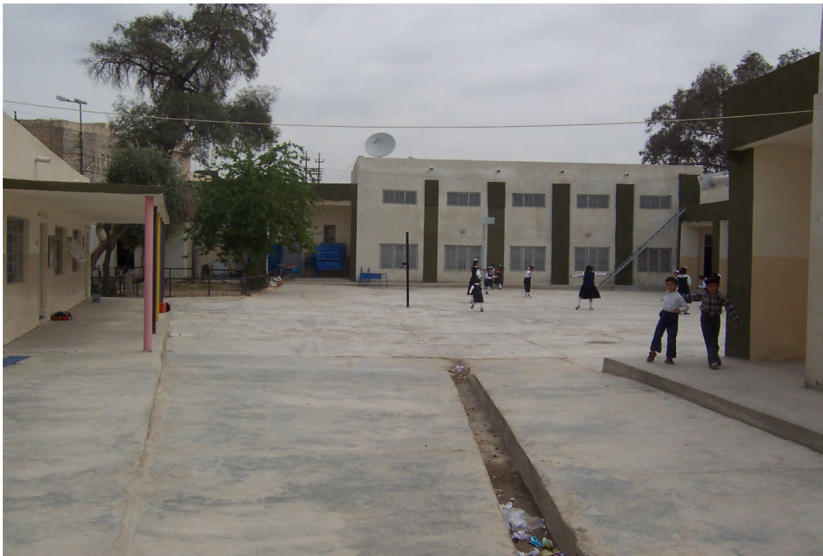
Ανακατασκευή Σχολείων Πρωτοβάθμιας και Δευτεροβάθμιας Εκπαίδευσης. Χρηματοδότηση: HELLENIC AID Υλοποίηση: ΜΚΟ «Ευρωπαϊκή Προοπτική» I P A K