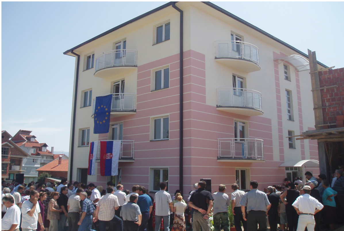
Βελτίωση του επιπέδου διαβίωσης στο Κοσσυφοπέδιο. Χρηματοδότηση: HELLENIC AID Υλοποίηση: ΜΚΟ «Ευρωπαϊκή Προοπτική» Σ Ε Ρ Β Ι Α