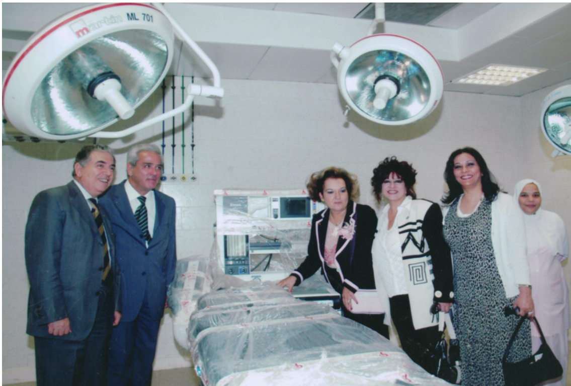
Εξοπλισμός Ιατρικού Κέντρου στην πόλη Beni Suef. Χρηματοδότηση: HELLENIC AID Υλοποίηση: ΜΚΟ «Ελληνική Δράση Αφρικής» ΑΙΓΥΠΤΟΣ