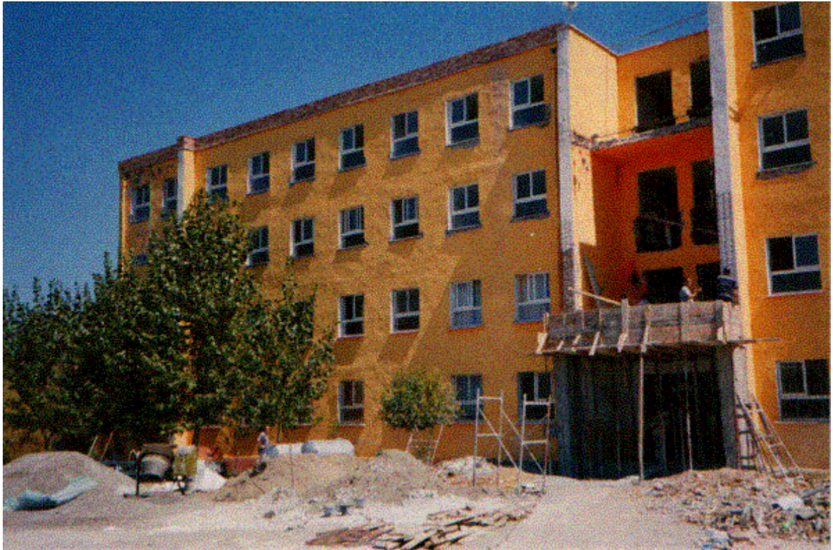
Ανακατασκευή Σχολικού Κτιρίου "16 SHATORY" στη Shijak. Χρηματοδότηση: HELLENIC AID Υλοποίηση: ΜΚΟ «Αναπτυξιακή Συνεργασία & Αλληλεγγύη» A L B A N I A