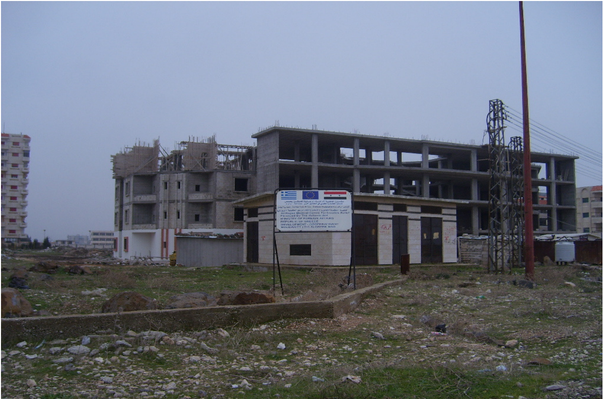
Κατασκευή Ιατρικού Κέντρου στην πόλη Homs με συνολικό εμβαδόν 700μ². Χρηματοδότηση: HELLENIC AID Υλοποίηση: ΜΚΟ «Αναπτυξιακή Συνεργασία & Αλληλεγγύη» ΣΥΡΙΑ